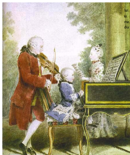
Familjen Mozart (Wolfgang Amadeus Mozart med sin pappa Leopold och sin syster Nannerl) reste runt i Europa flera gånger.

Nya strömningar inom musik, arkitektur och litteratur har under århundradenas lopp inspirerat konstnärer och artister i hela Europa. Titta på gotiska kyrkor i Spanien eller Polen eller lyssna på klassisk musik komponerad av italienska eller österrikiska kompositörer.