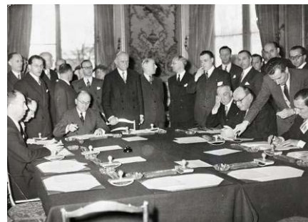
Fördraget om Europeiska kol- och stålgemenskapen undertecknades i Paris 1951.

För att trygga freden bestämde sig sex länder – Belgien, Frankrike, Italien, Luxemburg, Nederländerna och Tyskland – för att arbeta tillsammans. De grundade Europeiska kol- och stålgemenskapen för att gemensamt kontrollera det som krävs för att kriga: stål till vapen och kol till fabrikerna. På så sätt kunde länderna inte i hemlighet rusta sig för krig.