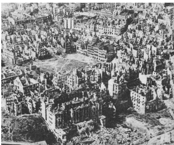
Nästan alla byggnader i Warszawa låg i ruiner vid slutet av andra världskriget.

Under 1900-talet startade i vår världsdel två stora krig som spred sig till andra länder runtom i världen.