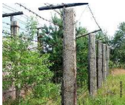
Rester av järnridån i f.d. Tjeckoslovakien

De länder som frigjorde sig från kommunismen ändrade sin lagstiftning, omvandlade sin ekonomi och blev EU-medlemmar. Idag har EU 28 medlemsländer (se sida 6).