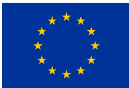
Europeiska flaggan antogs 1985 av Europeiska ekonomiska gemenskapen.

De sex länderna kom så bra överens att de bestämde sig för att ta nästa steg och bilda Europeiska ekonomiska gemenskapen (EEG). Med ekonomisk menas här pengar, företagande, sysselsättning och handel.